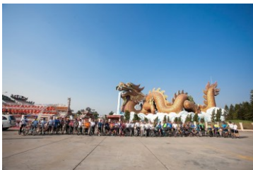
国際交流プログラム タイ

大阪府内の7ヶ所から回収した引き取り手のない放置自転車を修理・再生し、自転車を必要としているタイへ10月に350台の自転車を、またカンボジアに373台、合計723台の自転車を贈った。また、この補助事業を様々な団体やイベントと連携して広報し、また国際交流プログラムを通じて今後地域社会や国際社会で活躍、貢献できる人材育成への取り組みを行った。