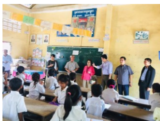
寄贈先の子も達と交流 カンボジア