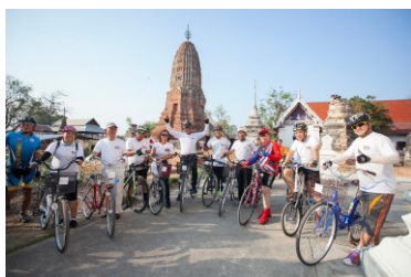
事業を支えるボランティア メンバー

贈られた自転車を地域の共有財産とし有効に活用することで、それまで不可能だった通学や仕事の効率化、生活の改善を可能にし、受益者達が自立への第一歩を踏み出し、将来をより良いものにかえていくことができるようになった。そのことが地域社会福祉環境の底上げとなり、ネットワークを活かして地域住民が互いに協力しながら地域社会を創造していくことにつながっている。事業を通じて地域共同体の結束が強まり、地域の他の問題解決に対する協力体制もより強固になってきている。さらに地球環境保全への意識を高めることで、国境を越えて同じ地球市民としての視点を持ち、互いに協力しあう国際交流の推進活動を広げていくことが期待される。自転車を通じて、日本と各国の国際交流が活発になり、人と人の絆が深まることによって、草の根の理解と協力の輪が広がることが期待される。