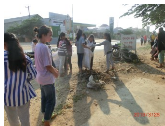
環境改善のためにゴミ拾いをする生徒達