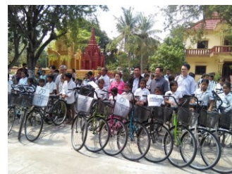
自転車贈呈式典 カンボジア