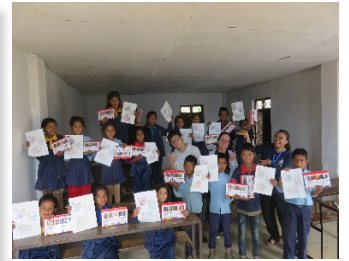
<学校交流/イメージ>

世界ではまだまだ多くの子どもたちが、貧困、紛争、自然災害などのさまざまな厳しい状況の中で生活をしています。このたび、公益社団法人アジア協会アジア友の会ではネパールでの社会貢献活動を目的としたツアーを日通旅行様とともに企画いたしました。このツアーでは、自然保護の大切さを学び、環境支援活動として植林を参加者で行います。また、現地小学校を訪問し、ボランティア活動を通じて現地の人々が置かれている状況を学び、グローバルな視野を養うことを目的としており、ご出発前に事前研修会も行います。