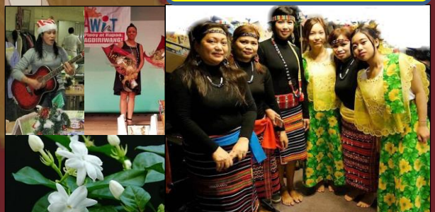
京都在住フィリピンコミュニティ