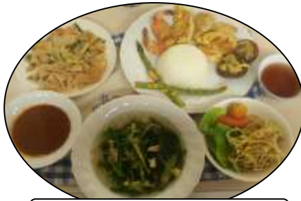
体があつたまる☆韓国料理