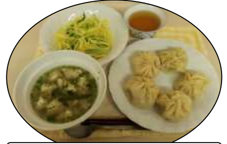
草原をイメージして❖モンゴル料理