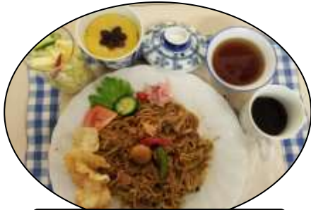
食欲そそる♥インドネシア料理

アジア各地域からの先生方が、それぞれの国の家庭料理について丁寧に教えて下さいます。日本料理とは違う食材や調理方法を学び、料理を頂きながら各国のお話を伺うのも楽しみです。お稽古しながら国際交流も楽しみましょう。こんなおいしいお話逃したらソンソン!!!