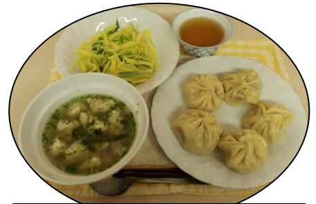
草原をイメージして❀モンゴル料理