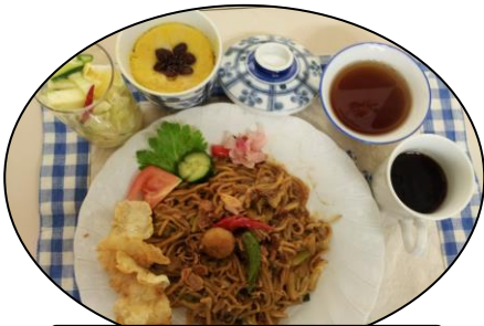
食欲そそる♥インドネシア料理

アジア各地域からの先生方が、それぞれの国の家庭料理について丁寧に教えて下さいます。日本料理とは違う食材や調理方法を学び、料理を頂きながら各国のお話を伺うのも楽しみです。お稽古しながら国際交流も楽しみましょう。こんなおいしいお話逃したらソンソン!!!