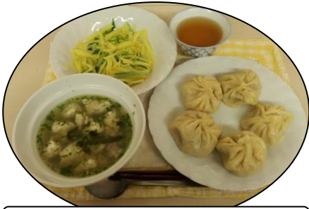
草原に思いをはせて☆モンゴル料理

アジア各地域からの先生方が、それぞれの国の家庭料理について丁寧に教えて下さいます。日本料理とは違う食材や調理方法を学び、料理を頂きながら各国のお話を伺うのも楽しみです。お稽古しながら国際交流も楽しみましょう。こんなおいしいお話逃したらソンソン!!!