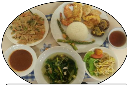
体の中からあつまる♪韓国料理