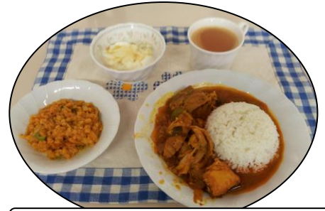
スパイスで元気になる☆スリランカ料理