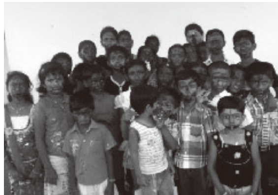
みんな一緒に遠足！（インド・タミルナード州）

このツアーによる参加費の一部は、インド・タミルナード州の最貧困地域に暮らす里子2名（8歳の女の子）の子どもが学校に通い続けられるようその支援に役立てられます。