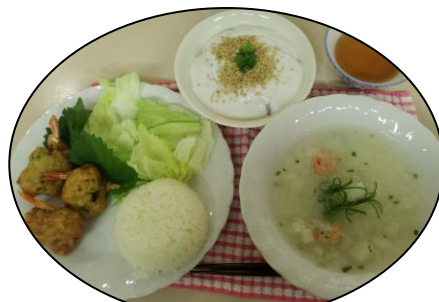
やさしい味付け☆ベトナム料理