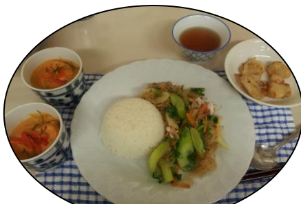
体の中から元気になる♪タイ料理