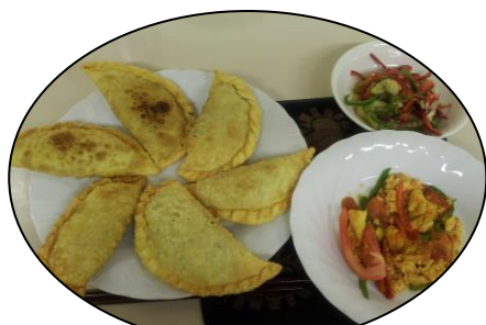
文化の出会い☆シルクロード料理

アジア各地域からの先生方が、それぞれの国の家庭料理について丁寧に教えて下さいます。日本料理とは違う食材や調理方法を学び、料理を頂きながら各国のお話を伺うのも楽しみです。お稽古しながら国際交流も楽しみましょう。こんなおいしいお話逃したらソンソン!!!