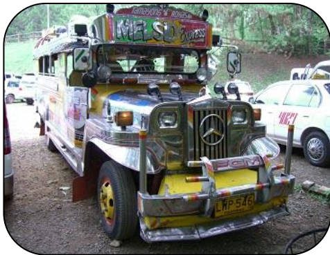
住民の大切な足 ジブニー