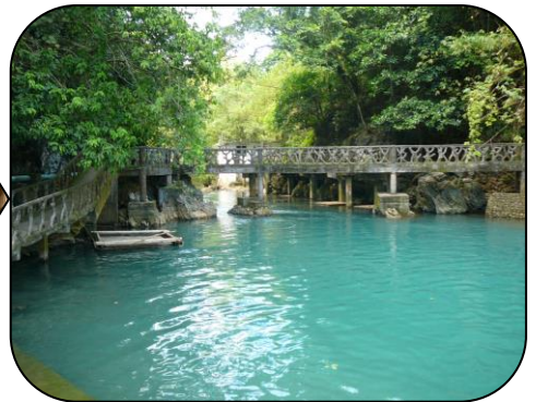
マロンパティの精水

【お問合せ・お申込み】 公益社団法人 アジア協会アジア友の会 (JAFS) 京都地区会 〒550-0002 大阪市西区江戸堀 1-2-14 肥後橋官報ビル 5F TEL 06-6444-0587 FAX 06-6444-0581 E-mail: asia@jafs.or.jp HP: http://www.jafs.or.jp