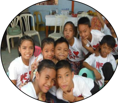
ストリートチルドレン 教育プログラム