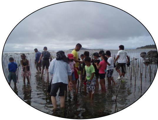
マングローブ植林プロジェクト