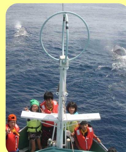
船に乗ってくじらウォッチングや世界遺産の熊野古道を体験!

参加費： 小学生 48,000円 （交通費含む） 中学生 50,000円 （参加者現住所が新宮市内の方に限り 28,000円）