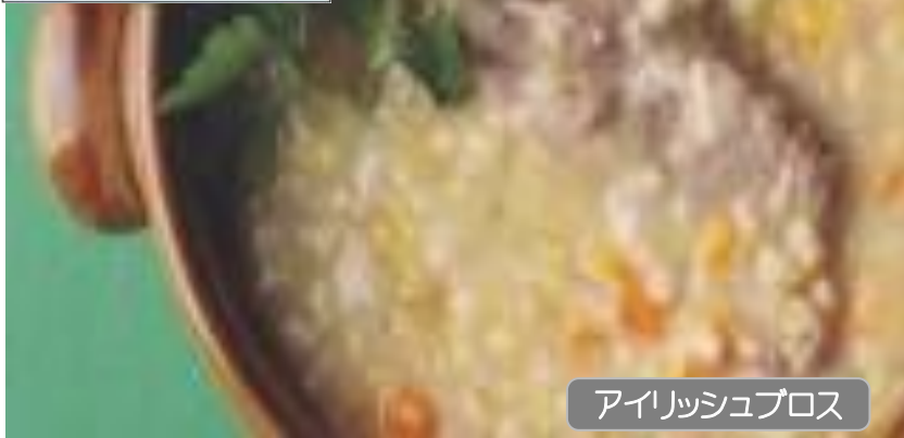
アイリッシュブロス