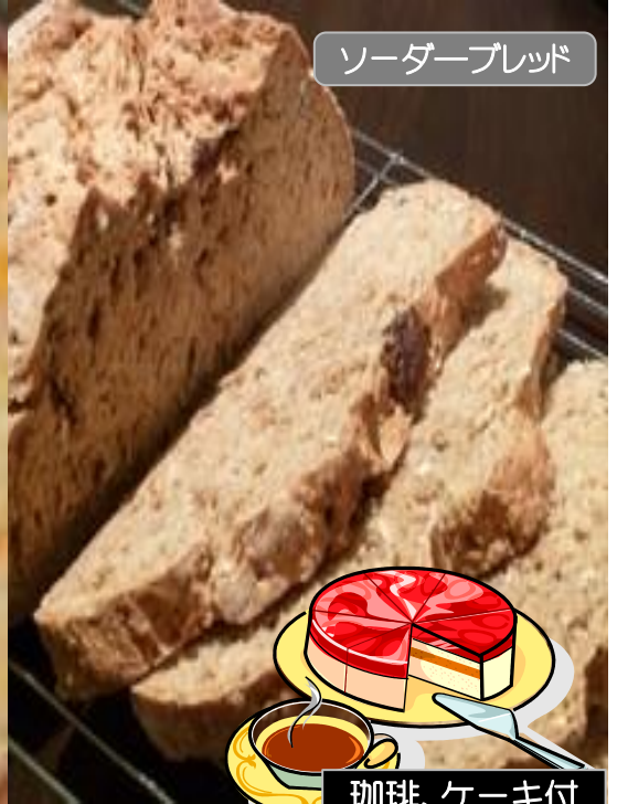
ソーダーブレッド