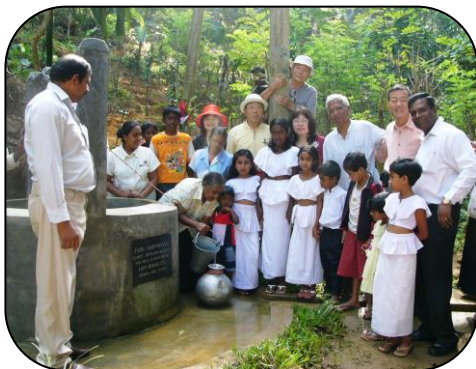
スタディツアーで贈った井戸を訪問