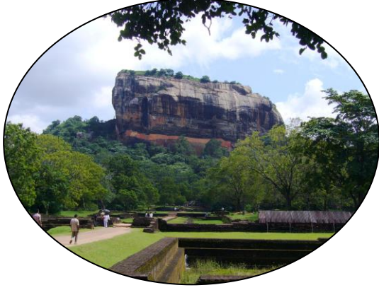
古都シギリヤのシギリヤロック