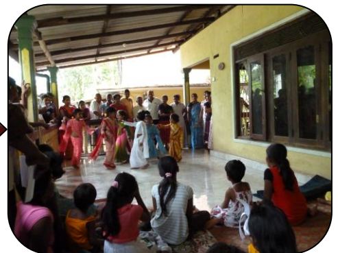
シュラマダーナキャンプ

【お問合せ・お申込み】 公益社団法人 アジア協会アジア友の会 (JAFS) 京都地区会 〒550-0002 大阪市西区江戸堀 1-2-14 肥後橋官報ビル 5F TEL 06-6444-0587 FAX 06-6444-0581 E-mail: asia@jafs.or.jp HP: http://www.jafs.or.jp