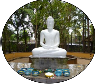
サルボダヤ平和センターの仏像