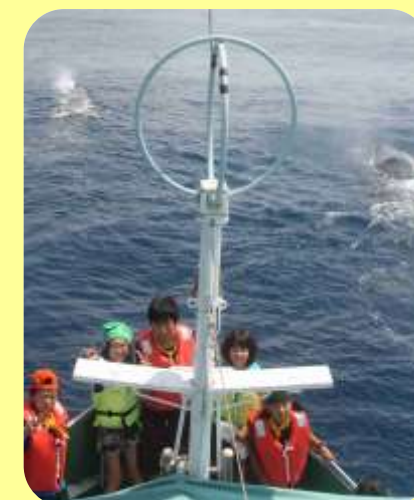
船に乗ってくじらウォッチング