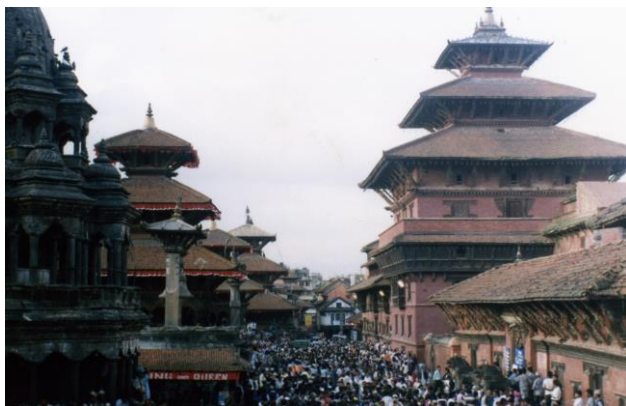
歴史深い寺が立ち並ぶ古都パタン