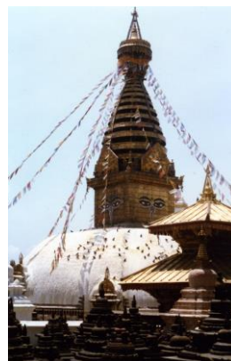
仏教寺院ソエンブー